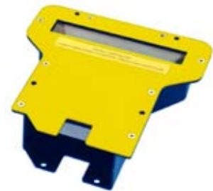
GFC-200 85° Umlenkspiegel