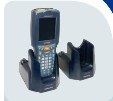
Einfach- und Mehrfach Übertragungsstation

Bitte beachten Sie die Gebrauchshinweise im Handbuch, das unter www.mobile.datalogic.com/manuals zum download bereitsteht. Weitere Informationen und Freeware auf: www.mobile.datalogic.com/skorpio