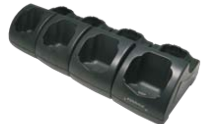
Mehrfach Lade-/Übertragungsstation (Ethernet)

Weitere Einzelheiten können Sie dem Benutzerhandbuch auf www.mobile.datalogic.com/manuals entnehmen. Mehr Informationen auch unter www.mobile.datalogic.com/datalogicjseries