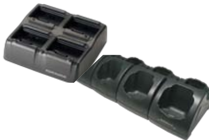
Einfach Lade-/Übertragungsstation und mehrfach Akkuladestation